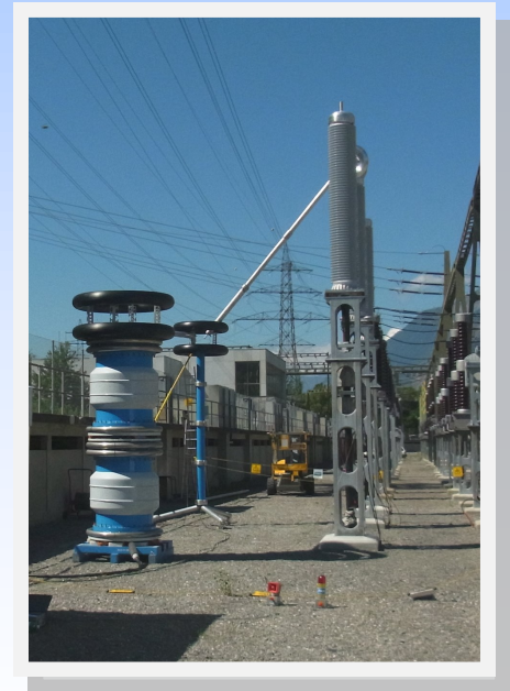
Hochspannungsresonanzprüfung an einer 275-kV-Kabelverbindung

➔ Konzept der integralen Prüfung von Gesamtanlagen